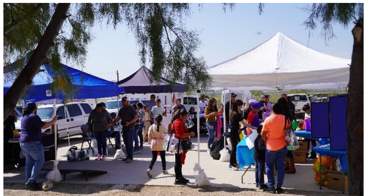
Tents included exhibitions as well as games for the children and adults. Las carpas incluyeron exhibiciones y juegos para niños y personas adultas.